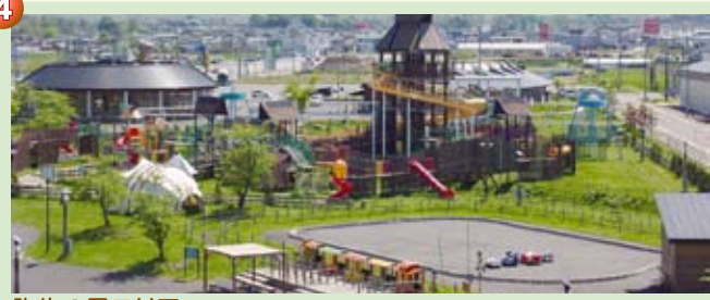
4 弥生の里エリア 道の駅いなかだてがある「弥生の里」周辺は、大型の遊具施設やレストランなどもあり、子どもから大人までみんなで楽しめるエリアです。

美濃国出身の僧侶・円空の寛文6~8年(1666~1668年)の作とされており、県内に見られる円空仏の中では最も早い時期の作品といわれています。 ※拝観希望の方は事前に中央公民館までご連絡ください。