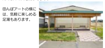
田んぼアートの横には、気軽に楽しめる足湯もあります。