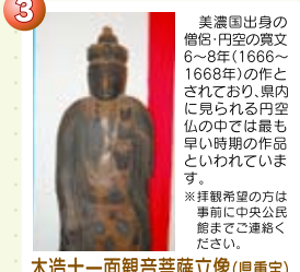
3 木造十一面観音菩薩立像(県重宝)

樹齢400年のサイカチの大樹が田舎館千徳氏五代掃部政武の居城の本郭に茂り、昔をしのばせています。