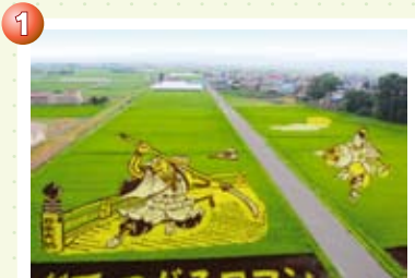
1 田んぼアートの里「いなかだて」 役場東側田んぼに「紫稲」「黄稲」「つがるロマン」等数種類の苗を使って毎年様々な図柄を描きます。夏には見頃をおかえ、たくさんの人を驚かせます。