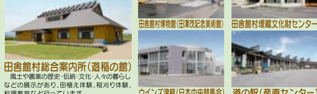
田舎館村総合案内所(遊稻の館) 風土や農業の歴史・伝統・文化・人々の暮らしなどの展示があり、田植え体験、稲刈り体験、料理教室など行っています。 田舎館村博物館(田澤茂記念美術館) 田舎館村埋蔵文化財センター ウインズ津軽(日本中央競馬会) 道の駅(産直センター)